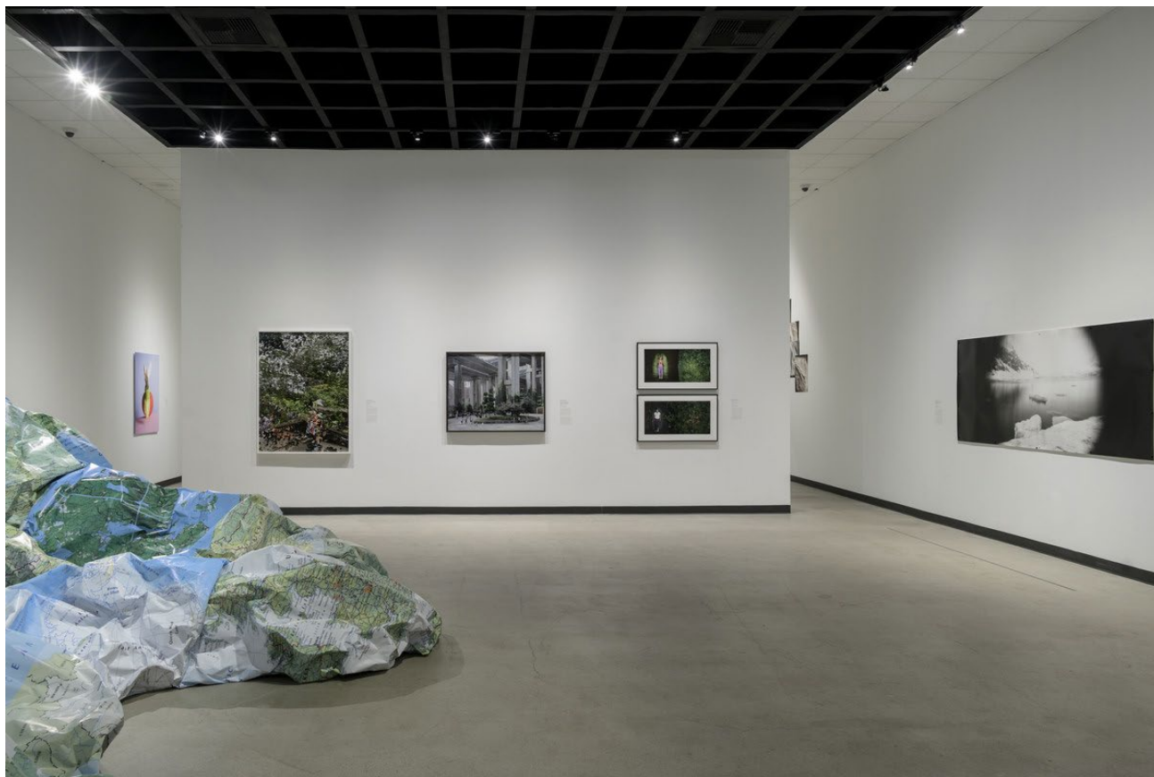
Fotografía de la exhibición, “ Nature on Notice: Contemporary Art and Ecology (La naturaleza en alerta: Arte contemporáneo y ecología)”, Galería de la Escuela Primaria Charles White, 21 de diciembre de 2024 – 2 de agosto de 2025, foto © Museum Associates/LACMA

Cuando esté listo, ¡podré entrar a la galería a mirar las obras de arte! Cada año hay una exposición diferente y algo nuevo para ver. La fotografía de arriba es un ejemplo de lo que podré ver. Es posible encontrar obras en las paredes y en el piso. Hay muchas maneras de recorrer la galería: puedo ir hacia la izquierda o a la derecha. Hay varios salones para visitar.