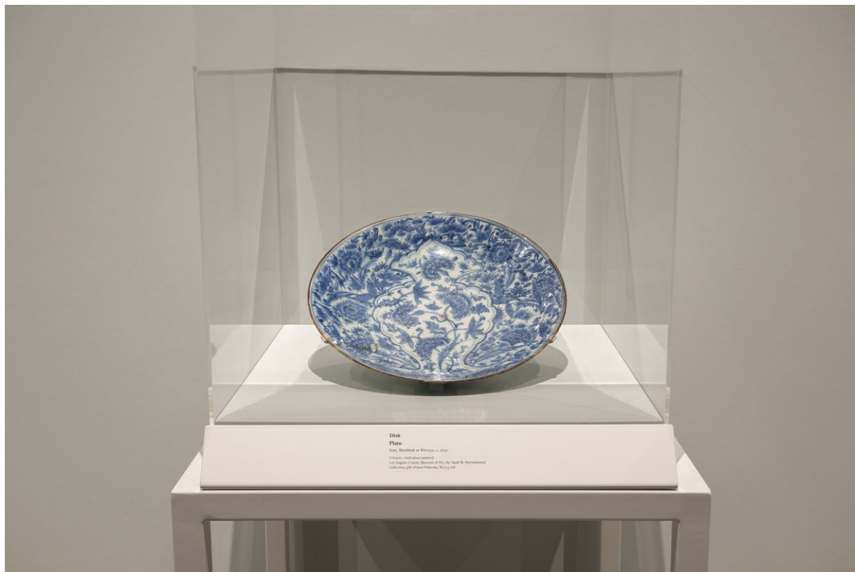
Fotografía de la exhibición “ Dining with the Sultan (Cenando con el sultán)” en el Charles White Elementary School, Los Angeles County Museum of Art 20 de enero– 10 de agosto de 2024

También es posible ver obras de arte sobre mesas protegidas con vidrio. Puedo observar las obras, pero no tocarlas. El texto junto a la obra me da más información sobre ella.